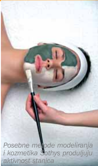
Posebne metode modeliranja i kozmetika Sothys produljuju aktivnost stanica