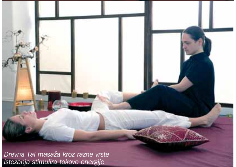
Drevna Tai masaža kroz razne vrste istezanja stimulira tokove energije

specifičan je blic tretman za osvježavanje kože čistim vitaminom C. Kada je riječ o muškoj koži, Man Face predstavlja anti-age tretman za muškarce od 30-te godine nadalje. Svi navedeni tretmani mogu biti koristan i maštovit poklon najdražima, prijateljima ili poslovnim partnerima u obliku poklon bona.